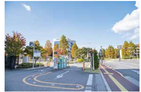
ホテル専用駐車場入口