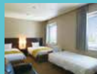
トリプル (3名様利用)