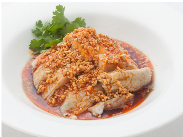
よだれ鶏 桃花林風 ¥2,100

【実施期間】2013年6月25日(火)～8月31日(土)まで (※8/10～16を除く)