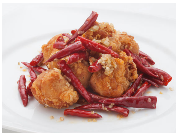
つくば鶏の唐揚げ 山椒・唐辛子風味 ¥1,785