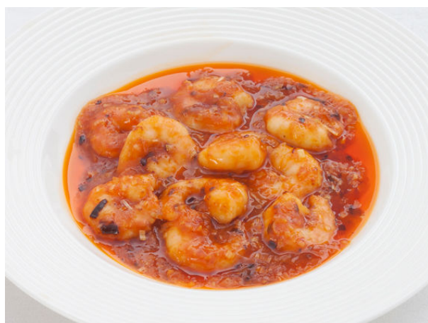
強辛海老のチリソース煮 ¥2,205