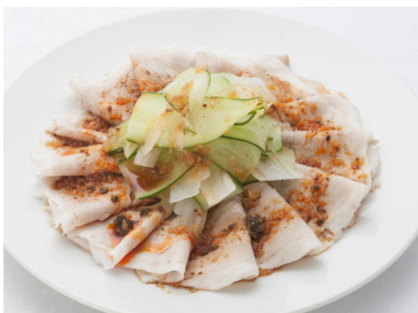
味麗豚 冷製薄造りニンニクソース ¥2,100