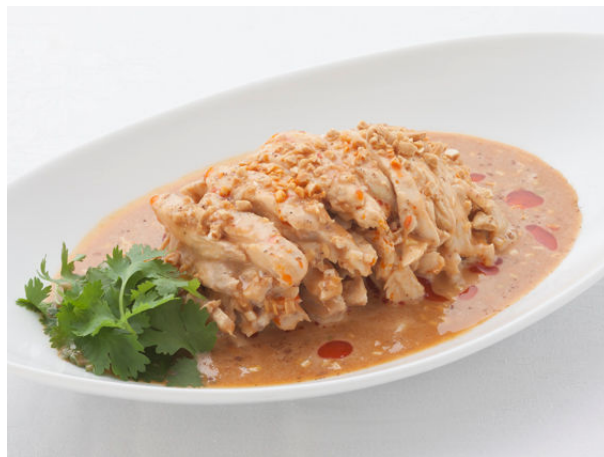
つくば鶏細切り強辛胡麻ソースかけ ¥2,310