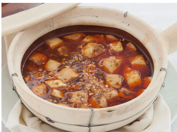
四川風 麻婆豆腐 土鍋煮込み ¥1,785