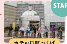
ホテル日航つくば

江戸時代の面影残る情緒ある街並み 筑波山神社の門前町として古くから栄えてきた北条の街並みをゆっくり散策。