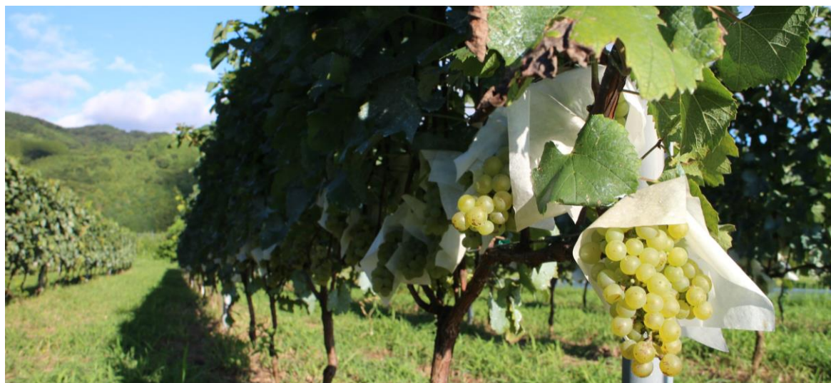
Bee's Knees Vineyards のブドウ畑