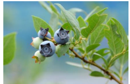
ブルーベリーのイメージ