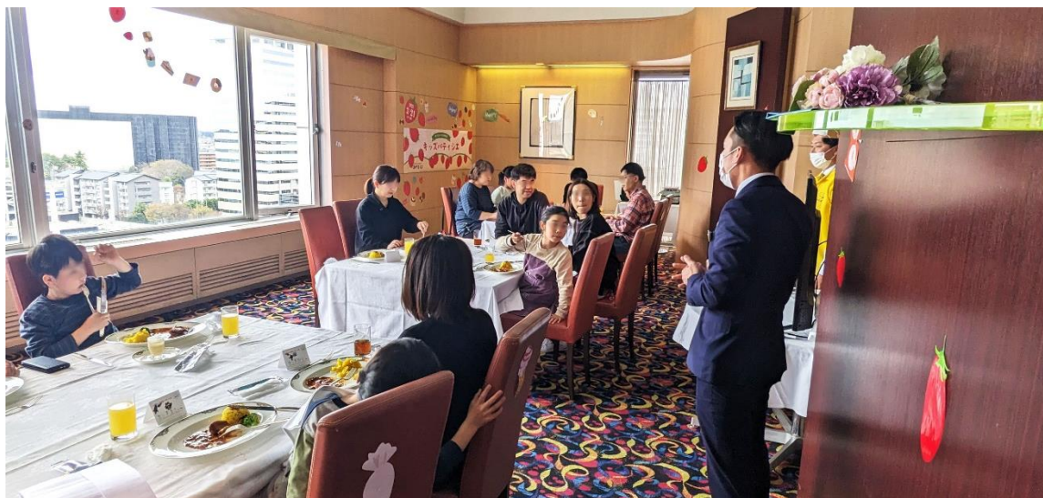
第2回の開催風景(2023年3月21日)

本プロジェクトの第3弾として、市内のブルーベリー農園「クイーンズブルーベリーガーデン」とコラボレーションした親子料理教室『ホテルシェフに学ぶ料理体験！』を2023年7月8日(土)に開催します。