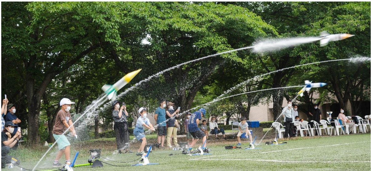
昨年の開催風景(2022年8月6日)

ホテル日航つくば(所在地:茨城県つくば市吾妻 1-1364-1、総支配人:高田 浩)は、お子様の夏休みの宿題におすすめな『ペットボトルロケット作り体験付き宿泊プラン』を2023年8月2日(水)～3日(木)と8月12日(土)～13日(日)に開催します。昨年の好評を受け、今年は日程を追加しての開催となり、本宿泊プランの販売を5月15日(月)より開始いたします。