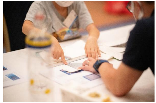
ロケット作り体験風景