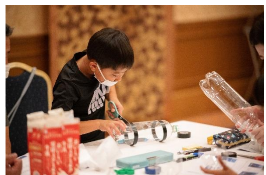
ロケット作り体験風景

https://secure.reservation.jp/okura-jalhotels/stay_pc/rsv/htl_redirect.aspx?lang=ja-JP&hi_id=14&page=plan&p_id=314